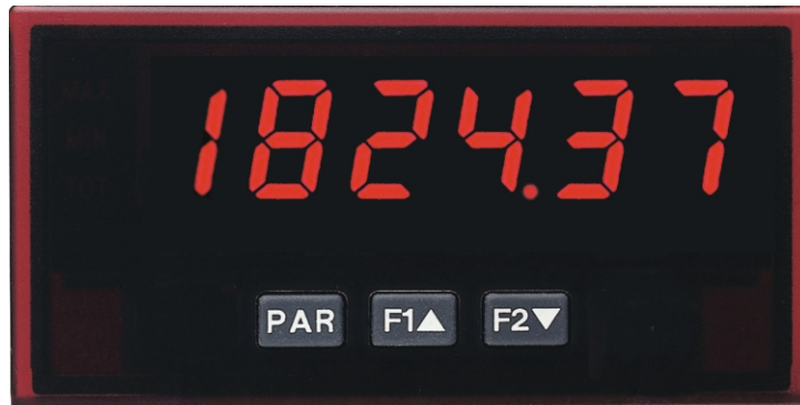
PAX LR in Originalgröße

Den Industrie - Tachometer PAX LR kann man natürlich auch als sehr flexibles und genaues Laborgerät einsetzen. Er wurde aber mit dem robusten Kunststoffgehäuse und der hohen Schutzart IP 65 für den rauen Industrieinsatz konzipiert. Die weltweit eingesetzte, ausgereifte und auf Langlebigkeit ausgelegte Elektronik erhält vor Auslieferung einen 3 Tage langen Qualitätstest unter Vollast. Das Gerät wird direkt über 3 Tasten schnell und sicher projektiert.