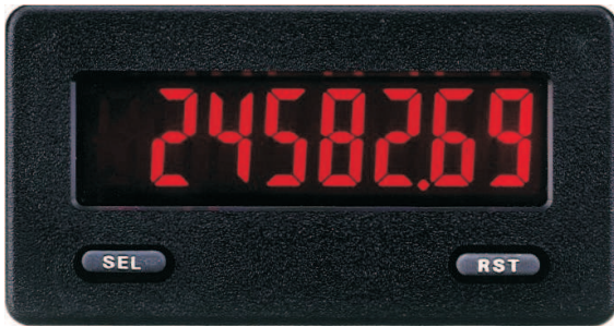
CUB5B000 in Originalgröße

Der CUB5 ist eine preiswerte Anzeige für 2 Zählwerte und eine Geschwindigkeit. Er kann z.B. als Positions-, Drehzahl-, Stückzahl-, Geschwindigkeits- oder Durchfluss-Anzeige und Stapelzähler verwendet werden und läßt sich durch seine einfache Programmierung sofort in Betrieb nehmen.