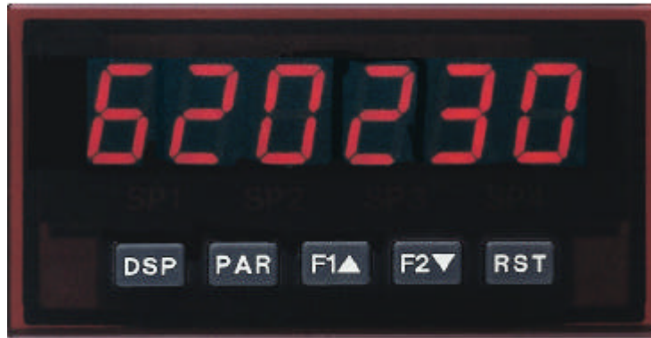
PAX C in Originalgröße

Der Industrie - Zähler PAX C kann natürlich auch als sehr flexibles und genaues Laborgerät eingesetzt werden. Er wurde aber mit dem robusten Kunststoffgehäuse und der hohen Schutzart IP 65 für den rauen Industrieinsatz konzipiert. Die weltweit eingesetzte, ausgereifte und auf Langlebigkeit ausgelegte Elektronik erhält vor Auslieferung einen 3 Tage langen Qualitätstest unter Vollast. Das Gerät wird entweder über den PC oder direkt über 5 Tasten schnell und sicher projektiert. Der Bediener freut sich über die übersichtliche Bedienoberfläche mit der er einfach alle Parameter auf einen Blick erfassen und leicht verändern kann. Mit der steckbaren Grenzwertkarte kann er auch nachträglich aufergüstet werden.